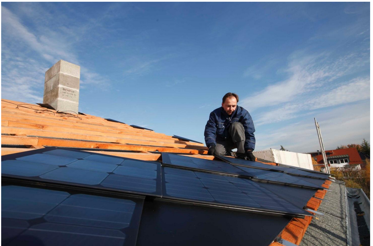
4.2 PV-Schindeln in die Traglattung einhängen