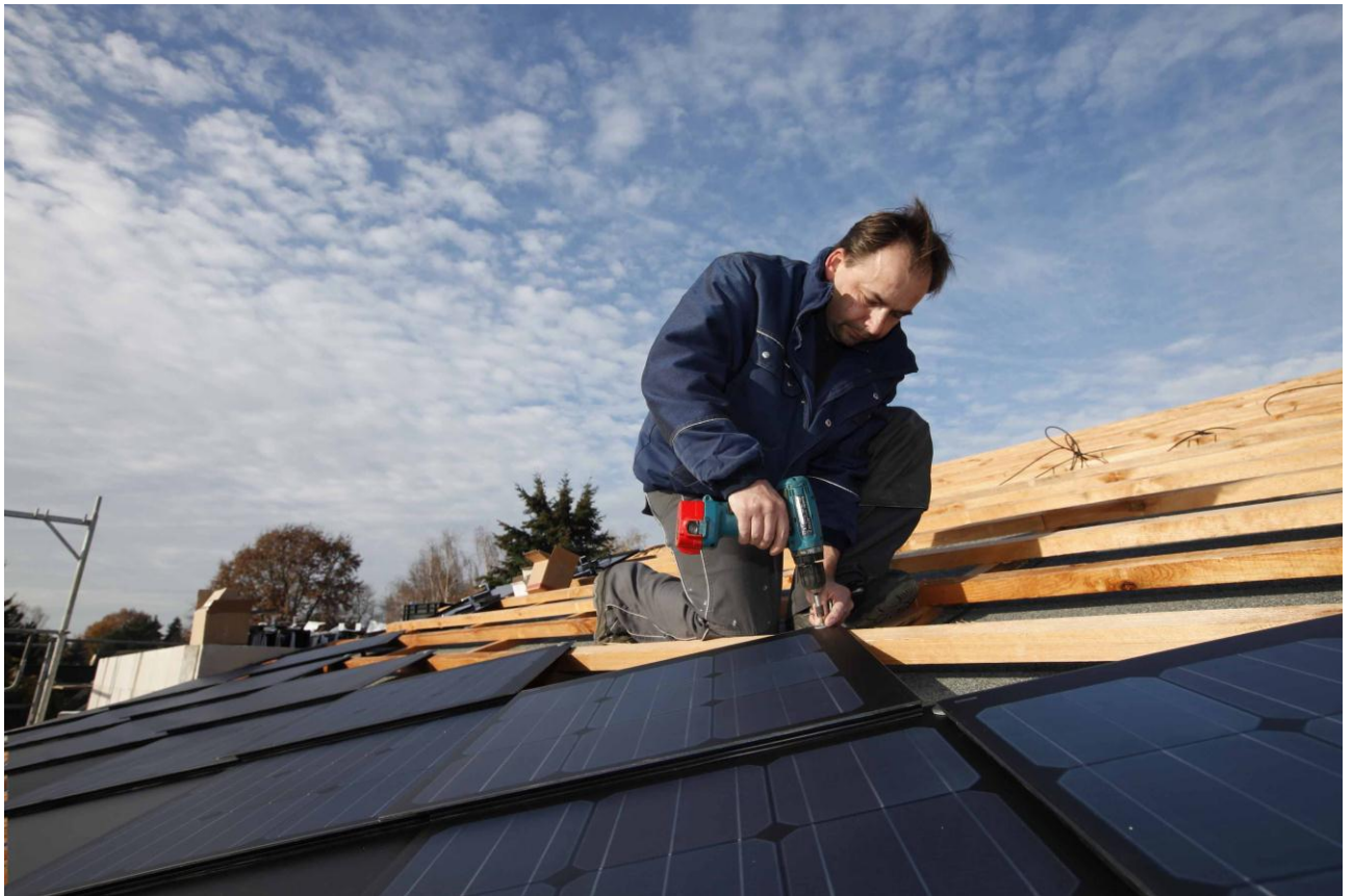
4.3 Mit Spezialschraube fixieren – fertig !