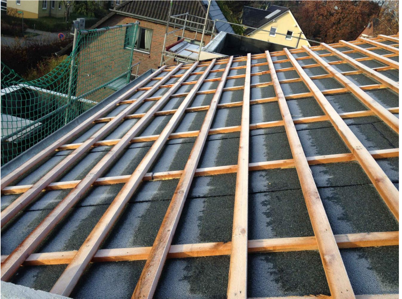
1. Wasserdichte Unterbahn und Holzlattung