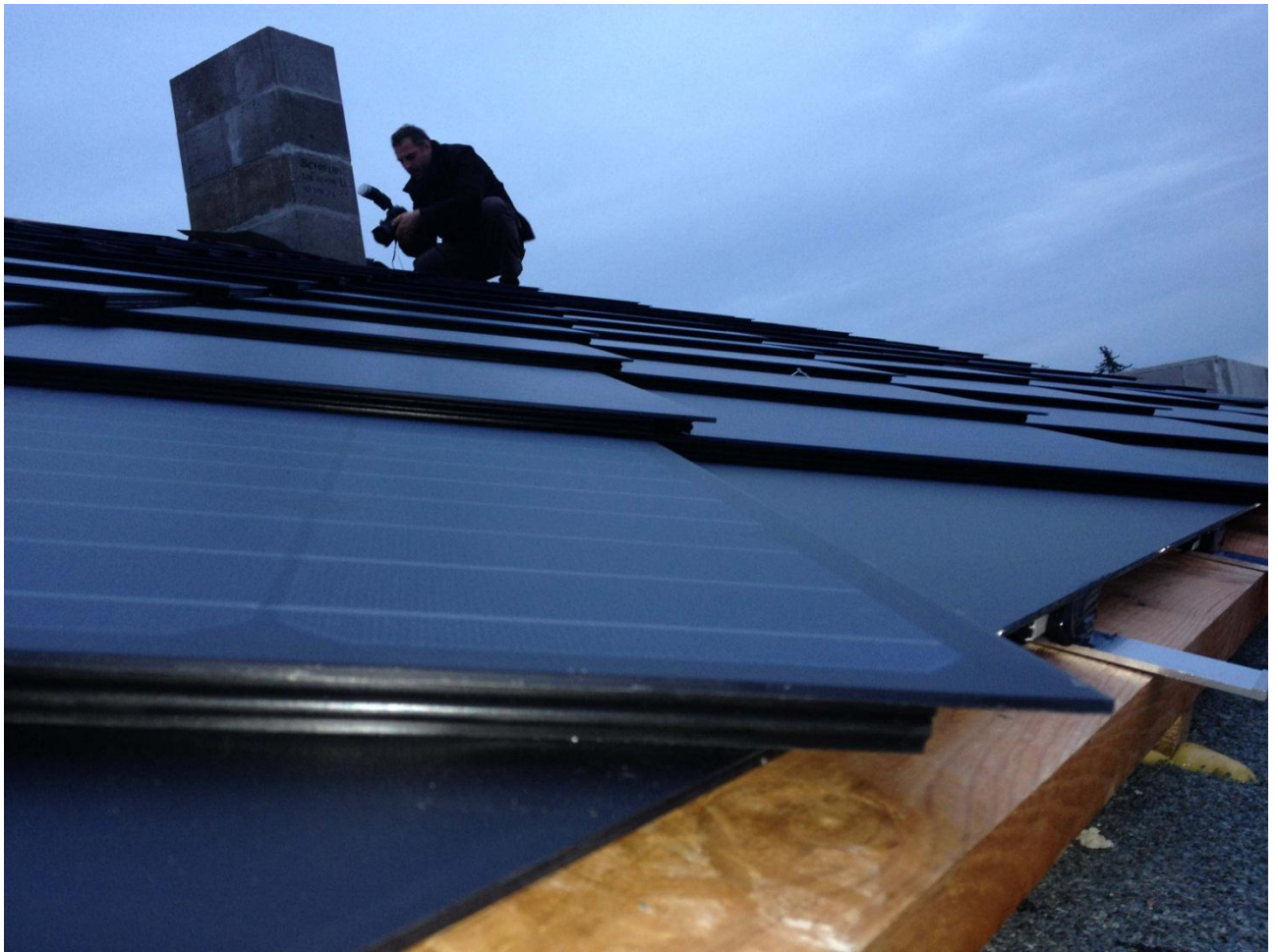
6. Perfekte Auflage der Spezialdichtung gegen Wasser und mechanische Stöße