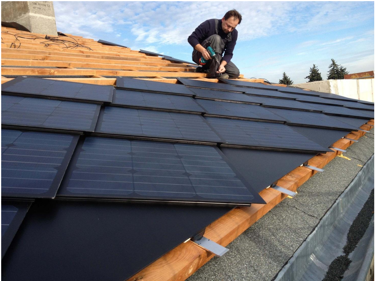
5. Weiter nach oben aufbauen