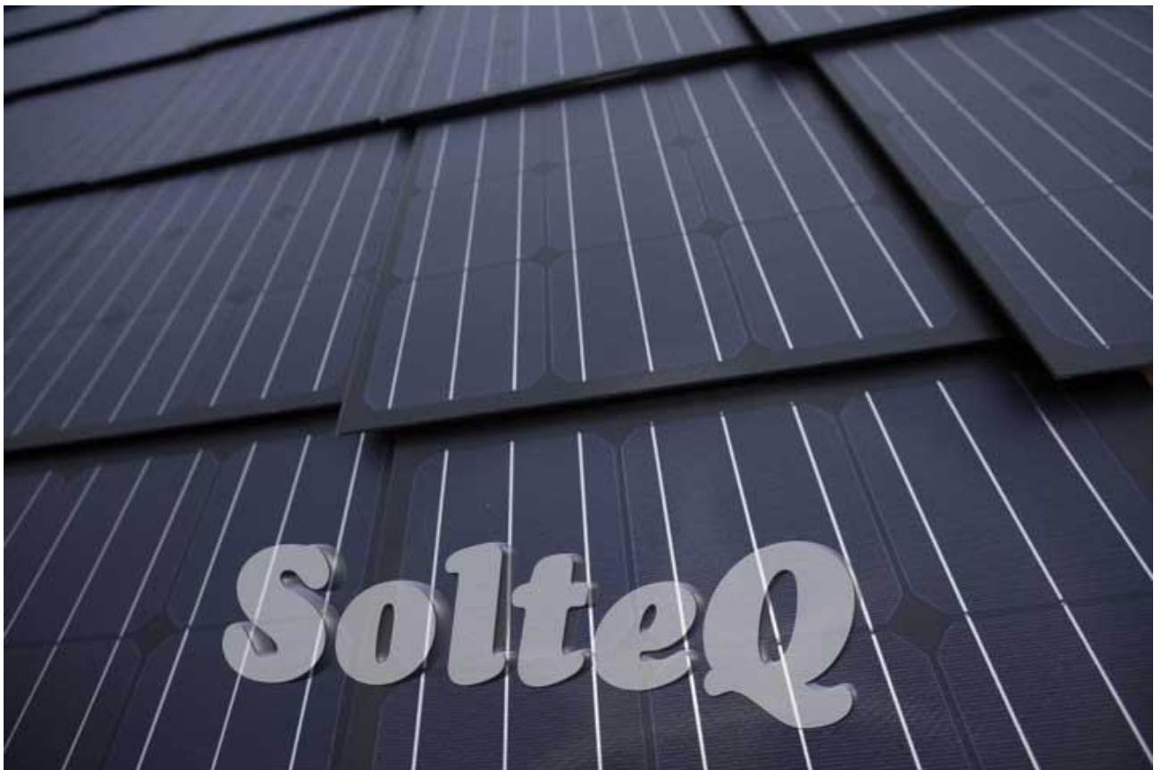
7. Fertiges Dach