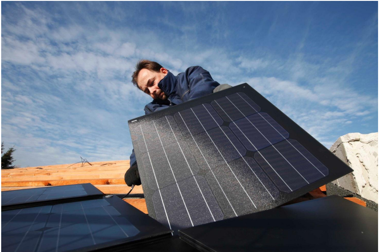
4.1 Stecker zusammenstecken