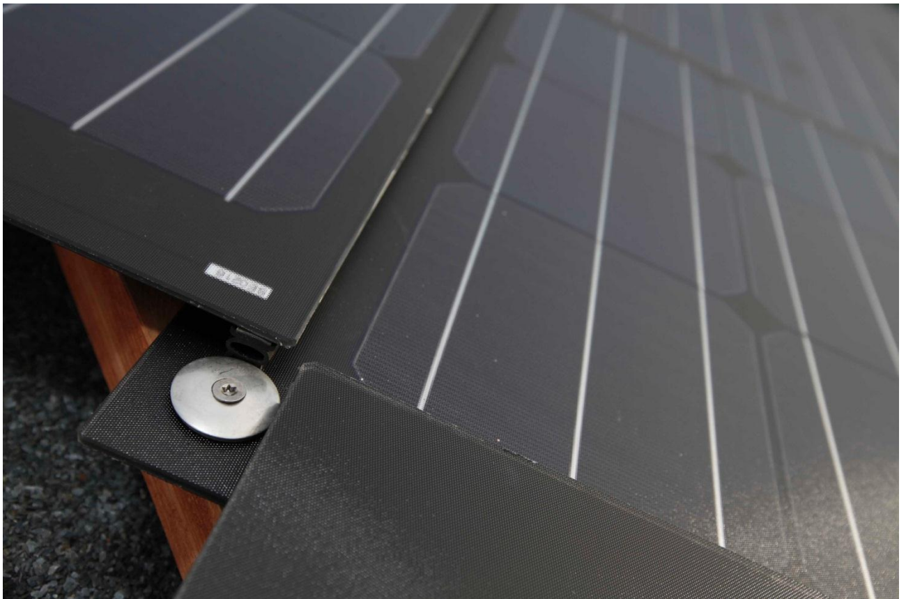
Spezialschraube mit Federdichtung