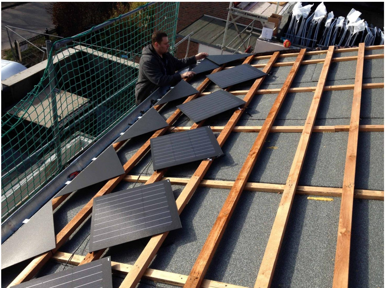
4. Jetzt von unten nach oben die Reihen legen. Dabei immer die Spannungen messen.